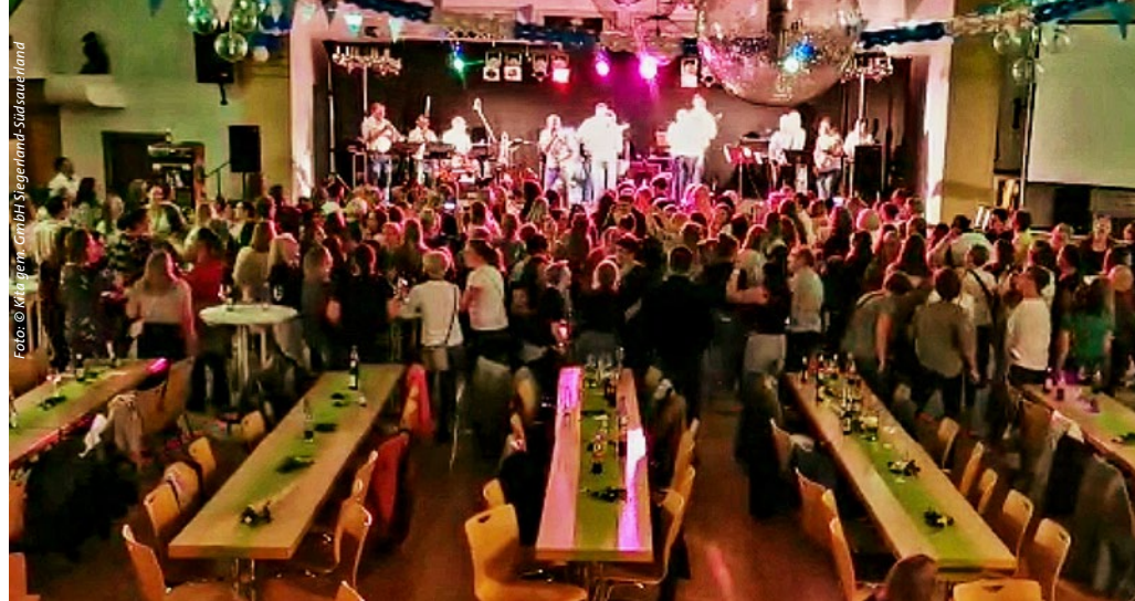
Bei stimmungsvoller Livemusik der Tanzband „Spätschicht“ blieb niemand mehr sitzen.